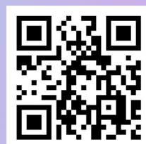
Official site QR